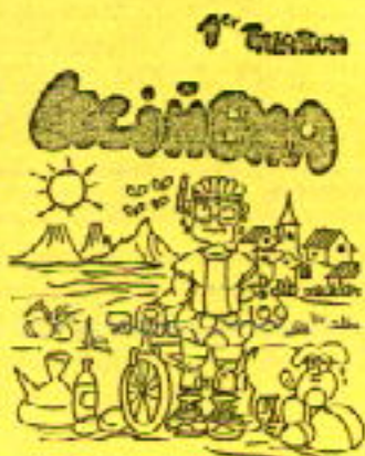
Lecifena, 17 de Agosto