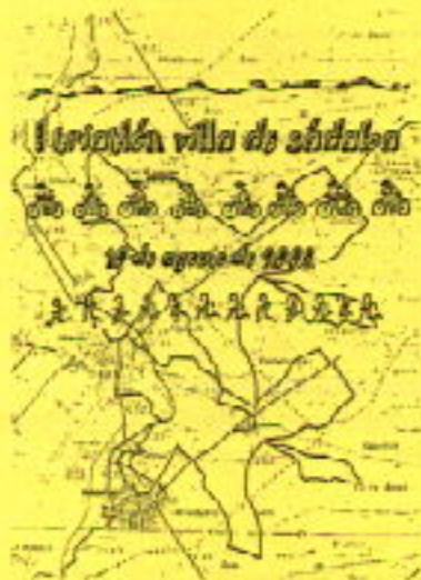
Sádaba, 10 de Agosto