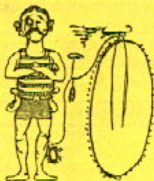
Tauste, 3 de Agosto