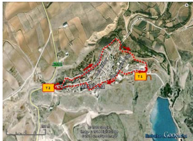
Circuito carrera a pie

Segmento carrera a pie: El recorrido de la carrera a pie transcurre por zona urbana y alrededores, con piso de asfalto y cemento gran parte del recorrido. Es un recorrido con desniveles positivos y negativos. En los cruces y giros conflictivos o dudosos se situarán voluntarios para indicar su trayectoria a la vez que su debida señalización. Se realizarán 2 vueltas y media. Dos vuelta completas (partiendo de la T2) y otra mitad de la tercera vuelta hasta alcanzar el arco de Meta situado en el Camino de las Heras junto a la T1, donde se dará por finalizada la competición.