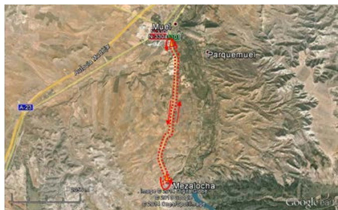
Recorrido ciclista por A-1101

Área de transición de ciclismo a carrera a pie (T2): La segunda área de transición está ubicada en la entrada del pueblo de Mezalocha, en la Calle San Antonio. Una vez completado el recorrido de ciclismo, tras dejar el material de ciclismo y coger el de carrera a pie, se dará comienzo al último segmento de la prueba.