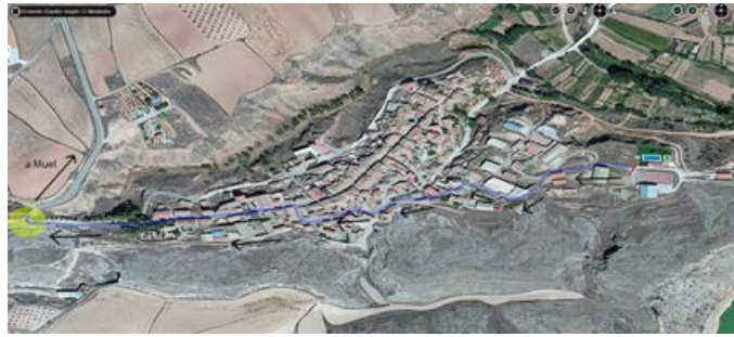
Recorrido Urbano (salida bici de T1 a enlace circuito).