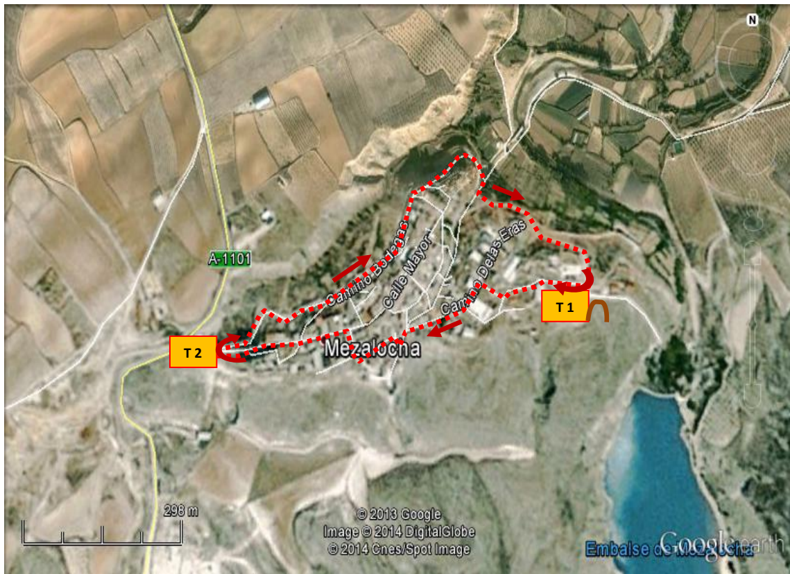
Circuito carrera a pie