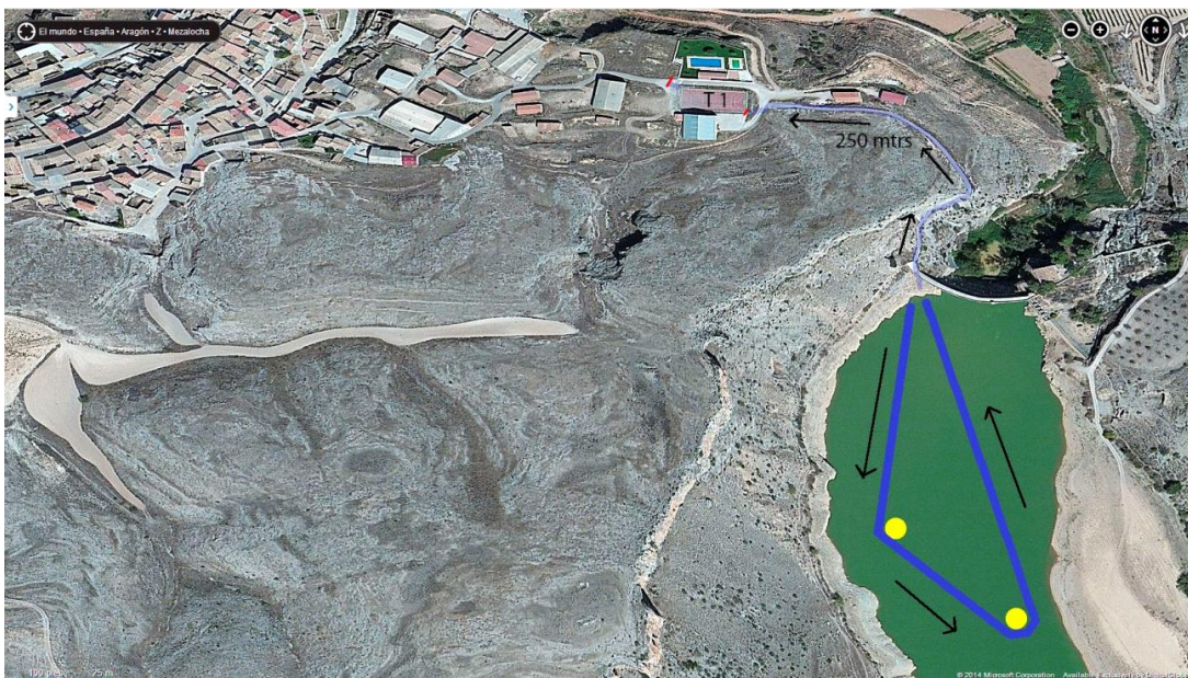
Natación y primera transición

Dando salida junto a la presa del Embalse de Mezalocha, en su margen izquierda, el día 31 de Mayo a las 17 horas se iniciara la prueba, teniendo que completar 750m de recorrido acuático en forma de triángulo marcado con boyas a rodear por su parte exterior. También se señalará la salida del agua hacia la transición para garantizar la orientación y dar fluidez a la prueba.