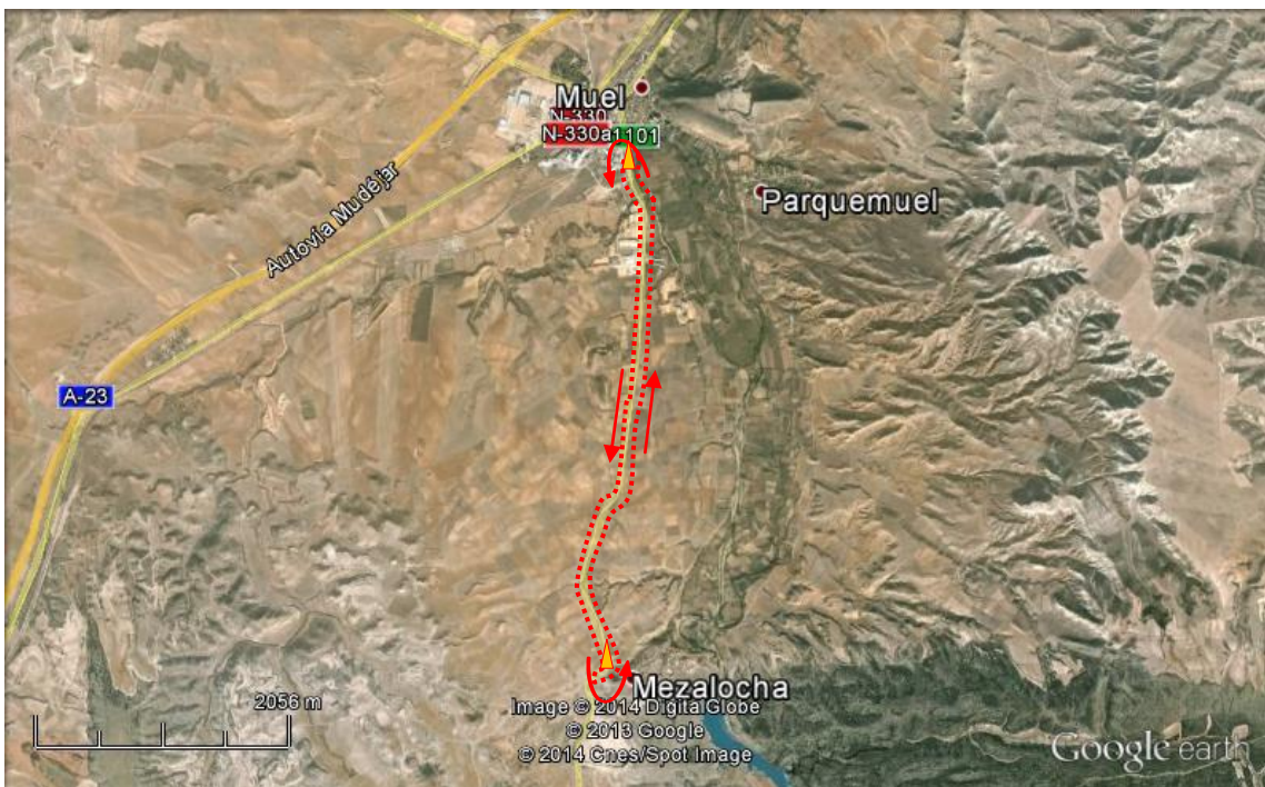
Recorrido ciclista por A-1101