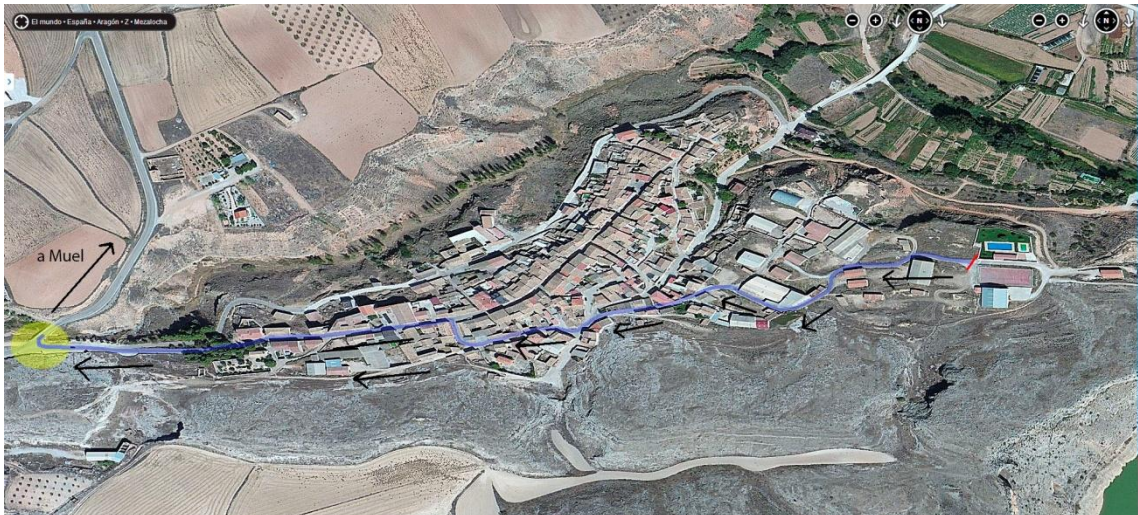
Recorrido Urbano (salida bici de T1 a enlace circuito).