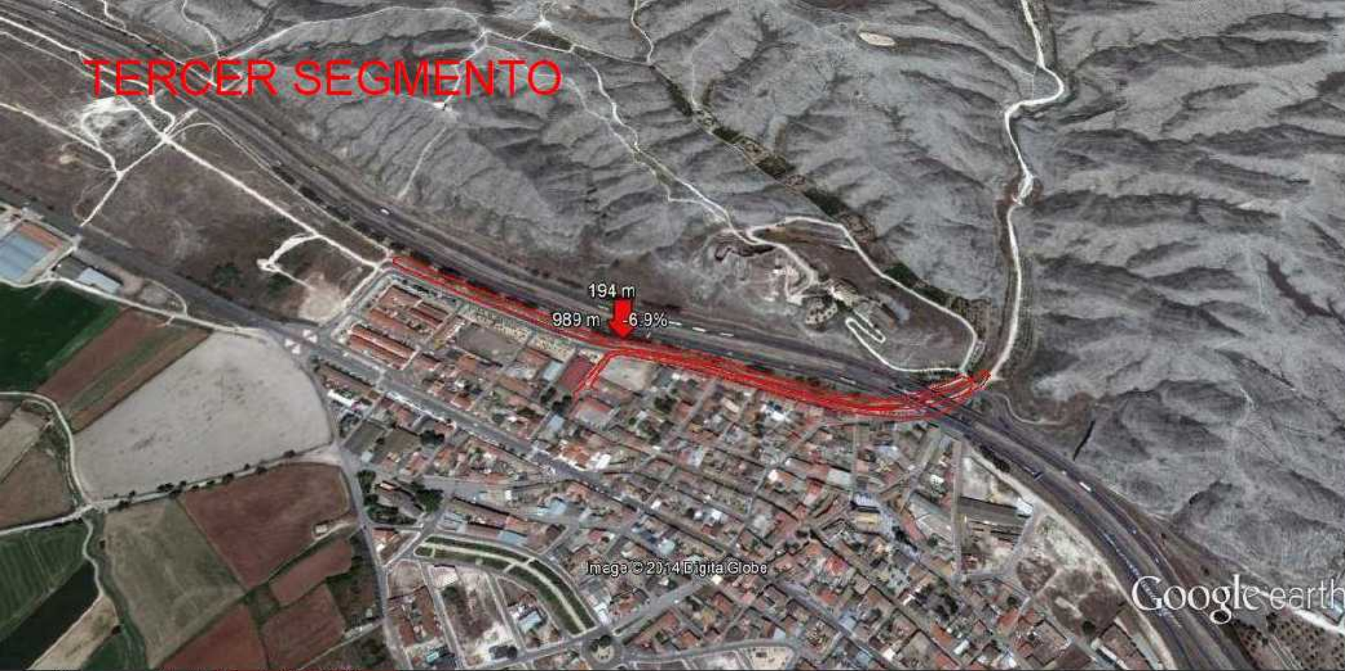
Gráfico: min. media. máx. Elevación: 191, 197, 204 m.

Total de intervalo: Distancia: 2.75 km Incremento/pérdida de elevación: 30.6 m. -30.7 m Pendiente máxima: 8.7% -9.8% Pendiente media: 2.1% -2.2%