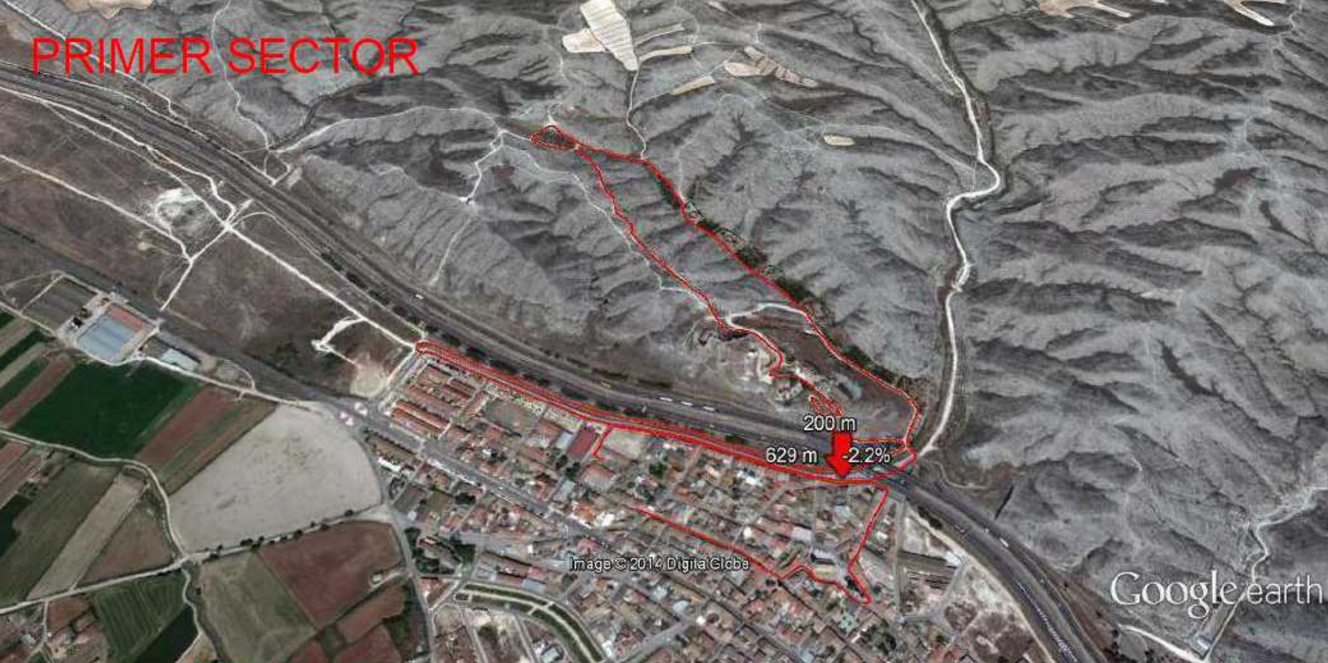
Gráfico: min., media, máx. Elevación: 191, 212, 255 m Total de intervalo: Distancia: 4.75 km Incremento/pérdida de elevación: 107 m, -108 m Pendiente máxima: 24.1%, -21.8% Pendiente media: 4.3%, -4.1%